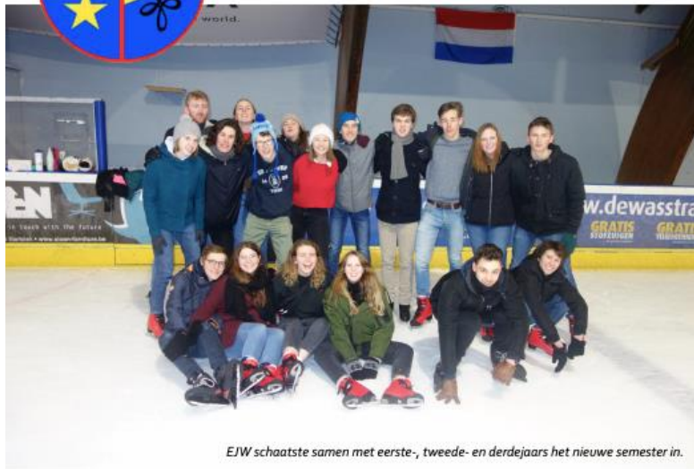
EIJW schaatste samen met eerste-, tweede- en derdejaars het nieuwe semester in.

Wekelijks blaadje van studentenkring Wina verspreid onder studenten wiskunde, fysica en informatica.